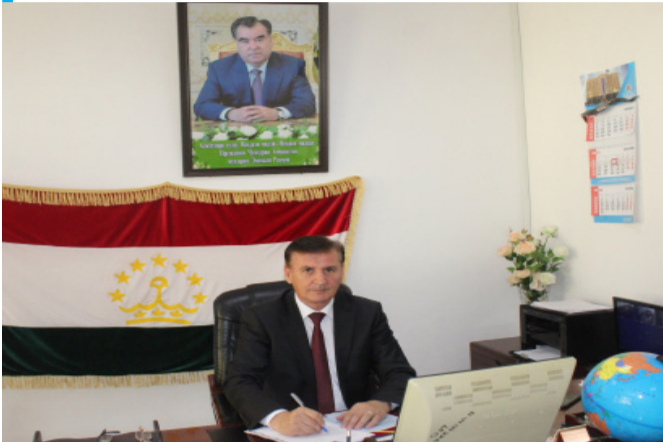
Исозода Диловаршоҳ Тариқ, ректори Донишкадаи энергетикӣ Тоҷикистон

Барои аҳли омӯзгорон, донишҷӯён ва кормандони дигари Донишкадаи энергетикӣ Тоҷикистон соли 2022 ҳамчун як давраи пурмасъулияти бо дастовардҳои муносибу сазовор истикбол намудани чашнҳои 31-солагии Истиқлолияти давлатии Ҷумҳурии Тоҷикистон ва 30-солагии Иҷлосияи Шӯрои Олии Ҷумҳурии Тоҷикистон сипарӣ гардид. Дар ин давра соҳаи илму маорифи ҷумҳурӣ тадриҷан рушд ёфта, ба натиҷаҳои назаррас ноил гардидааст.